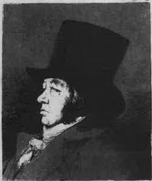
Franc. co Goya y Lucientes Pintor