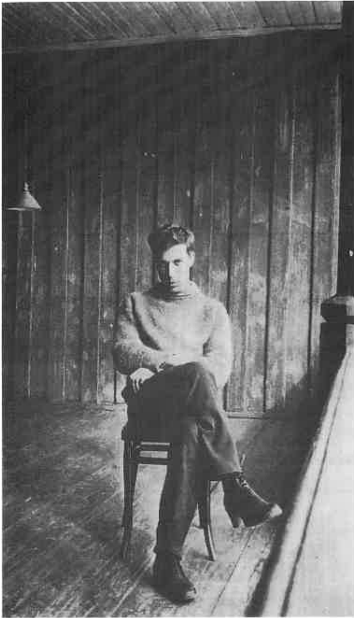
Boris Pasternak en 1916