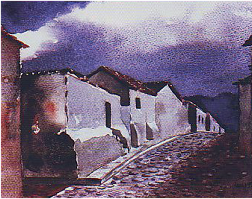
Acuarela de Luis Alfredo Arango

nicapán, lo retuvimos aún algunas horas, y llamé a su ataúd como cuando llamaba a su puerta los domingos, pero el poeta ya no me respondió, se había marchado y allí ya solo yacía su herida... “Y el pájaro de una sola pluma, voló”.