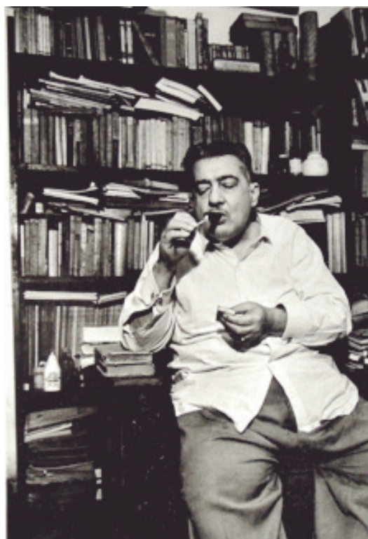
JOSÉ LEZAMA LIMA

tanto para fervorosos como para extraviados se trata de un escritor que no nos deja indiferentes.