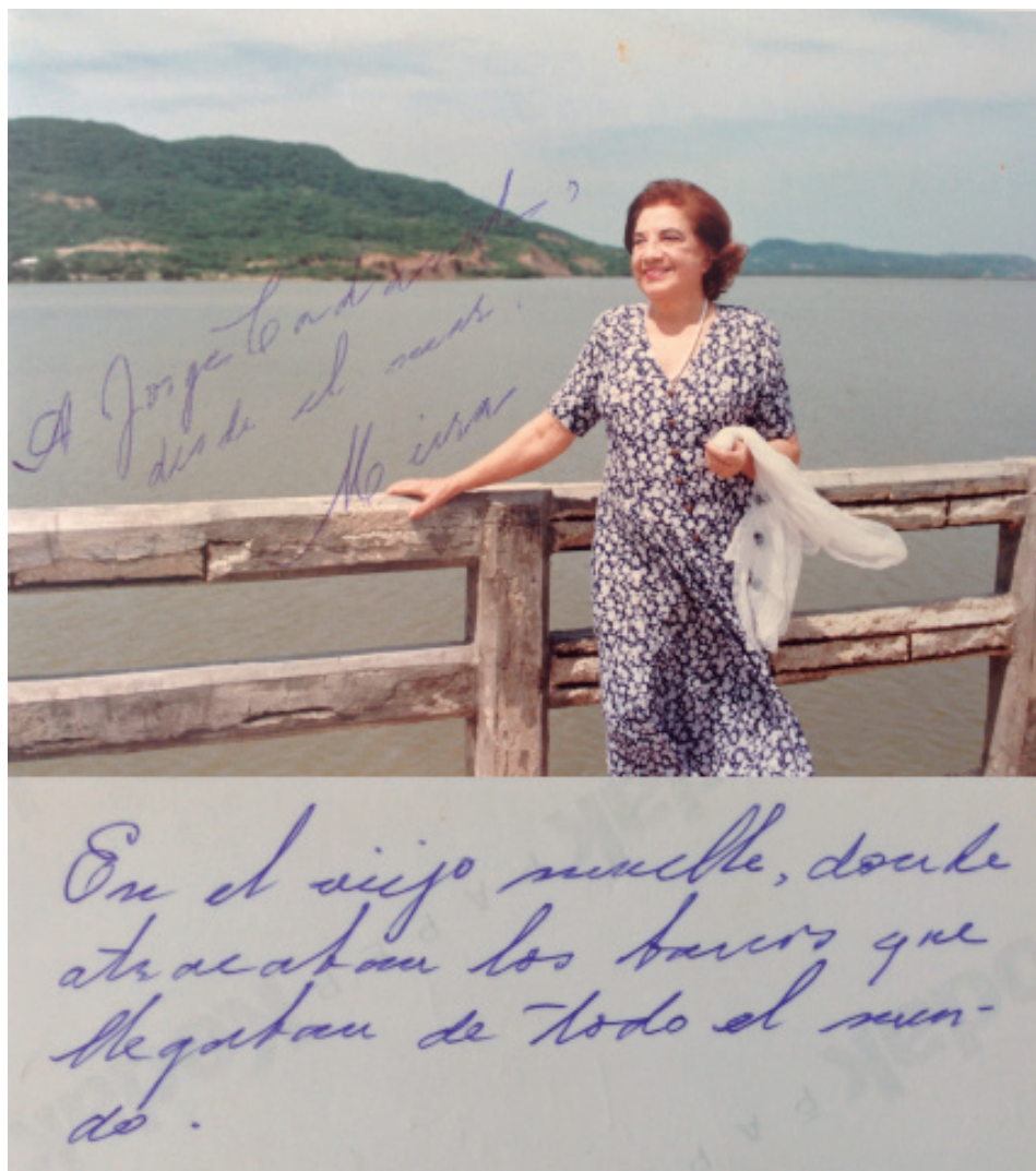
Foto de Meira Delmar cedida por el poeta colombiano Jorge Cadavid, quien la recibió de ella en el año 2000.

Este recorrido por algunos de los poemas de Meira Delmar y de su prosa nos permite, a la vez, recorrer los temas que la obsesionaron a lo largo de su escritura. Una escritura atravesada, no solo por el descubrimiento de la intimidad, sino de la relación entre la intimidad y la palabra poética, lo que es, en síntesis, una indagación sobre la belleza, aunque las imágenes que se formen en la memoria y que vuelven a instalarse en la retina sean devueltas con nostalgias terribles que enfrentan al poeta con la ausencia, con lo que ya no está. Con quien ya no está. Y, entonces, el amor y el dolor nos punzarían más hondo, sin el suave atenuante de su mirada consoladora [de la poesía], sin el eco de su voz innumerable que, cual un bálsamo de seda, posee el don de restañar la herida.